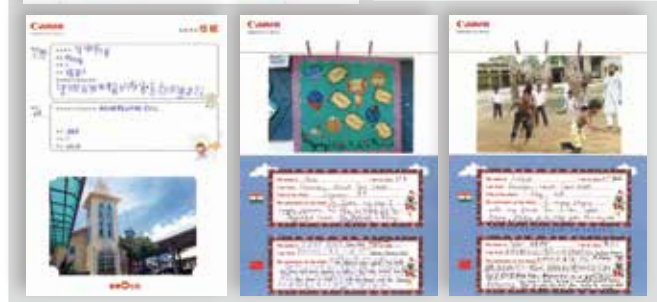
中国小学生通过交流卡与国外的同龄人进行影像文化交流