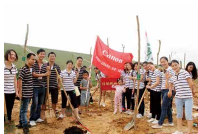
佳能深圳公司员工参加植树活动