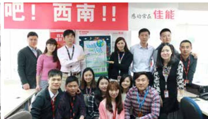
2016年“地球一小时”活动佳能（中国）员工书写自己的环保承诺