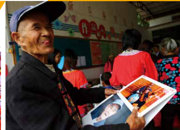
老人拿着一张自己的照片向旁人展示