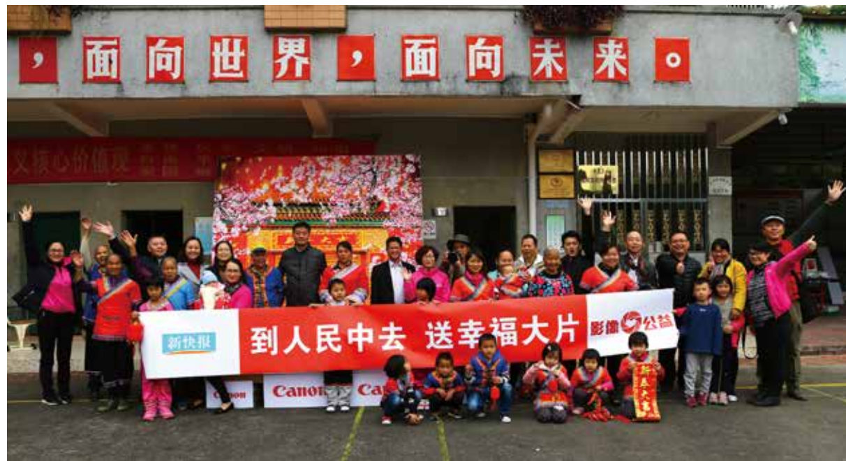
佳能（中国）员工与畲族村民合影留念

佳能（中国）认识到在自身努力的同时，更有必要通过自身的力量带动更多企业和公众共同参与公益，利用影像优势，走进社区，把快乐和感动的正能量传递给人们，把温暖送到真正需要爱心和关怀的地方。2016年1月9日，佳能（中国）广州分公司联合广东新快报社、广东省摄影家协会共同举行了“送幸福大片”活动，来到了广州市唯一的少数民族行政村——畲族村，为村民送去幸福大片以及新年祝福。在为村民拍照、打印照片之余，佳能（中国）还为村民们准备了丰厚的礼品，为学生准备了书包文具，为畲族群众准备了春联、挂历，以及适合老人在冬天使用的保温水瓶、套装饭盒等。