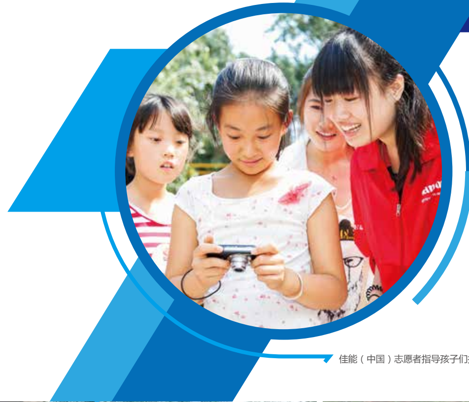
佳能（中国）志愿者指导孩子们拍摄照片

教育是社会发展的基础，佳能（中国）积极贡献自身的影像优势，通过影像教育支持孩子们茁壮成长与成才，佳能的公益教育项目“佳能影像之桥”以摄影教育提高孩子们的观察力、专注力，培养其细致、耐心的品性，帮助孩子们发掘、记录并分享影像带来的快乐。2014年佳能建立了亚洲首个青少年影像交流公益平台，让不同肤色、国籍、语言、民族的小朋友们都能够通过影像、照片零距离、完全平等地分享彼此成长的快乐，了解各地风俗文化，开拓视野，并收获珍贵的友谊。2015年“佳能影像之桥”先后走过了北京、桂林、上海、佛山、长沙、西安等地，为孩子们的学习生活带来了无尽的欢声笑语，同时也带给孩子们更多镜头下的人生感悟，架起了探索生活、传递友谊的桥梁。