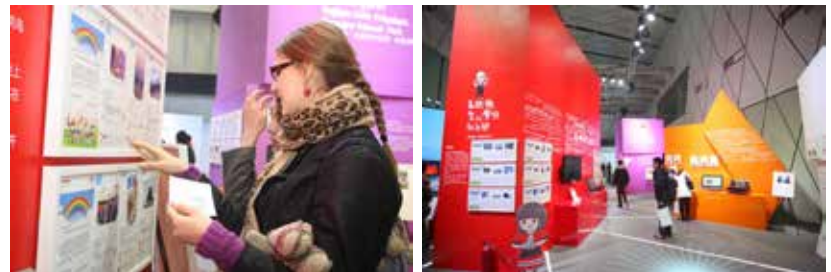
“佳能影像之桥”成果展吸引了来自国内外的众多参观者