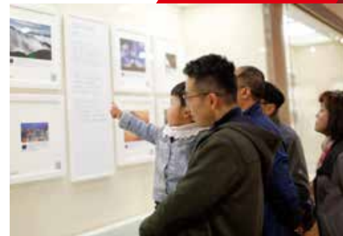
观众驻足观赏丝路影展