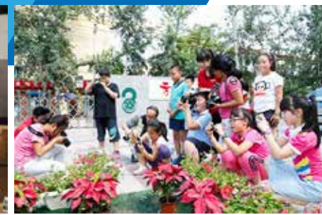
“小摄影师”们学以致用，认真构思，用自己手中的佳能相机记录下丰富多彩的校园生活和风景