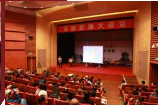
7 摄影大讲堂，讲解如何拍好丝绸之路的人文影像