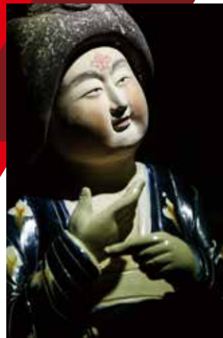
7 国家级非物质文化遗产 唐三彩烧制技艺