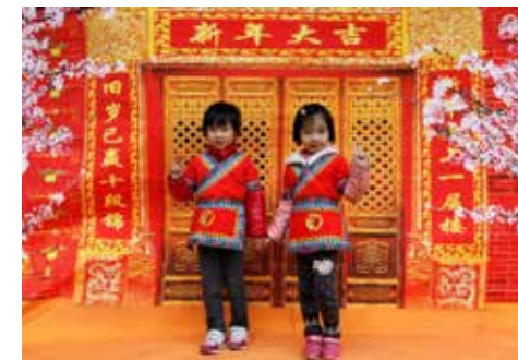
影棚和打印设备刚搭建好，大家从四面八方赶来，争着要成为第一个入镜的人