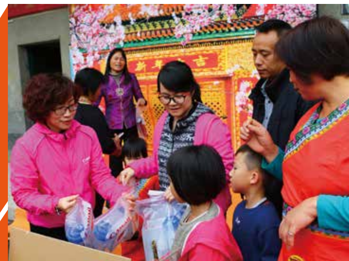
当畲族群众拿着自己及家人的照片，在现场喜笑颜开的时候，浓浓的年味提前在畲族村寨弥漫开来