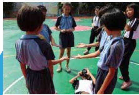
孩子们用手中的相机记录下美好的瞬间