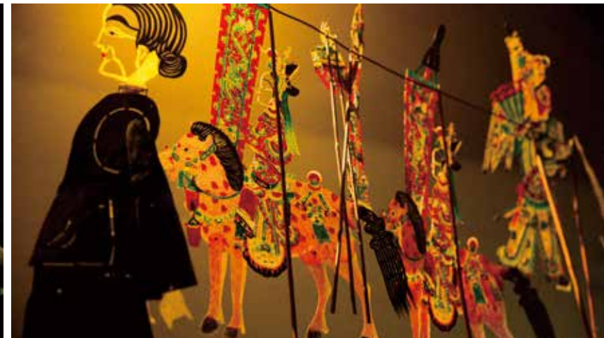
7 国家级非物质文化遗产华阴皮影