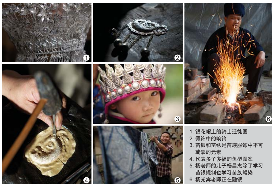
1. 银花帽上的骑士迁徙图 2. 佩饰中的响铃 3. 苗银和苗绣是苗族服饰中不可或缺的元素 4. 代表多子多福的鱼型图案 5. 杨老师的儿子杨昌杰除了学习苗银锻造也学习苗族蜡染 6. 杨光宾老师正在融银

和杨老师一样专注执着的小杨一边画着现代首饰设计图，一边拿着父亲作品进行比对，在摇曳的灯影中，在小杨专注的双手中，一件件崭新的银饰被注入了新的生机与活力，正肩挑着新的使命，走向明天。