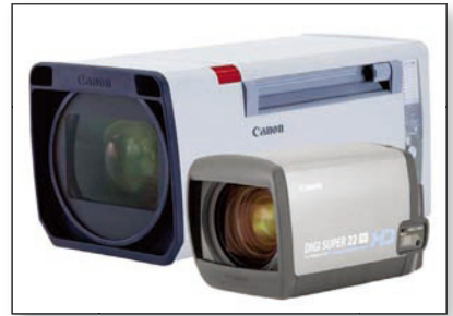
照片：小型XJ22高清演播室镜头与典型全尺寸高清演播室镜头的比较

全能与大型演播室镜头匹敌，但其间的差距并不大。在新设计中仍然采用与大型演播室镜头同样广泛的优化策略，以像平面MTF、对比度、相对光线分布、光学灵敏度和色彩还原方面为重点进行优化。这种全新的镜头加速实现了更具性价比、更小、更轻的演播室镜头-摄像机系统，从而可以使用较小的支架，非常适合于演播室机械系统。